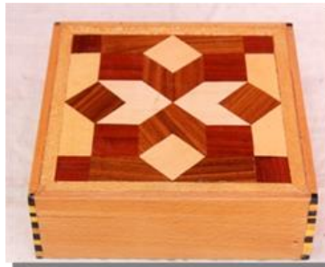
صورة رقم ( 13 )

تم تنفيذ هذه القطعة من خشب الزان مقاس 30*30 وباستخدام انواع القشرة المختلفة في تزيين غطاء العلبة بتصميمات هندسية مستوحاة من الحضارة الاسلامية وتم دهان العلبة بدهان الالستر الشفاف لاطهار تجازع الخشب وتم تنجيد العلبة من الداخل بالقطيفة المخملية والصورة رقم (13) توضح ذلك .