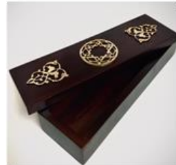
صورة رقم (7)