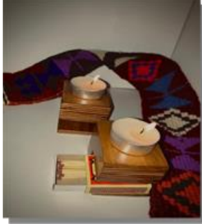
صورة رقم ( 11 )