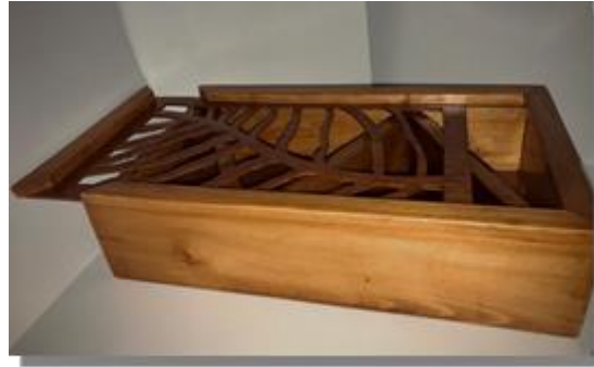
صورة رقم ( 9 )

تم تنفيذ العلبة من الخشب الموسكي مقاس 18*30 والمقسمة من الداخل بواسطة شرائح من نفس نوع الخشب وذات غطاء من خشب الابلكاش بوحدات زخرفية مستوحاة من اوراق الشجر ومدهونة بدهان الاستر بدرجتين الفاتح واللون البنى الغامق والتي تبرز تجازيع الخشب للون الفاتح كما في الصورة رقم ( 9 ).