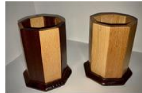
صورة رقم (5)