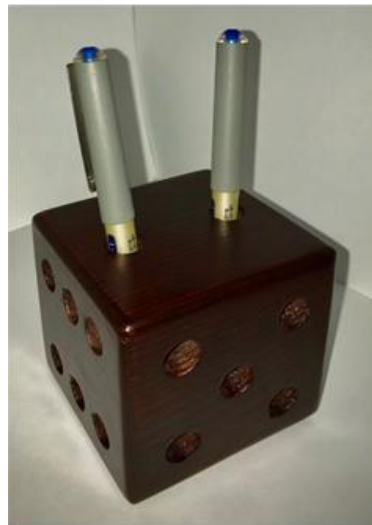
صورة رقم ( 6 )