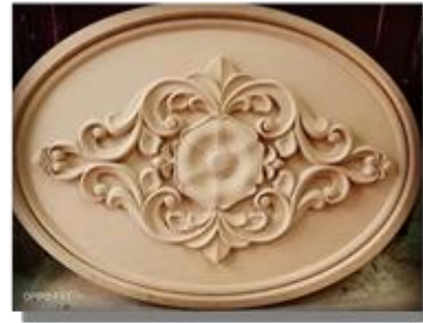
الحفر على الاخشاب

توضح الصورة رقم ( 1 ) بعضن الصناعات الثقافية علي المستوي المحلي