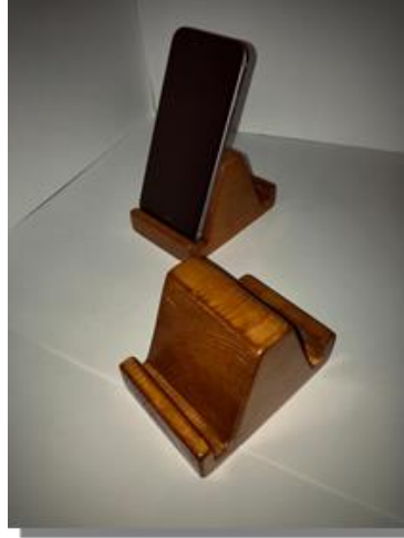
صورة رقم ( 12 )

تم تنفيذ هذه القطع من خشب الموسكي مقاس 8*6*2 وكذلك قطعة مقاس 10*7*2,5 والتي يمكن استخدامها كحوامل لاجهزة المحمول والكروت الشخصية ومدهونة بدهان الالستر الفاتح الذي يبرز تجازيع الخشب وقائمة علي فكر الصناعات الثقافية التي تحقق كافة معايير التصميم الداخلي من اقتصادية وجمالية ووظيفية كما في الصورة رقم ( 12).