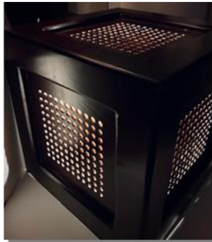
صورة رقم (2)

توضح الصورة رقم ( 1 ) بعضن الصناعات الثقافية علي المستوي المحلي