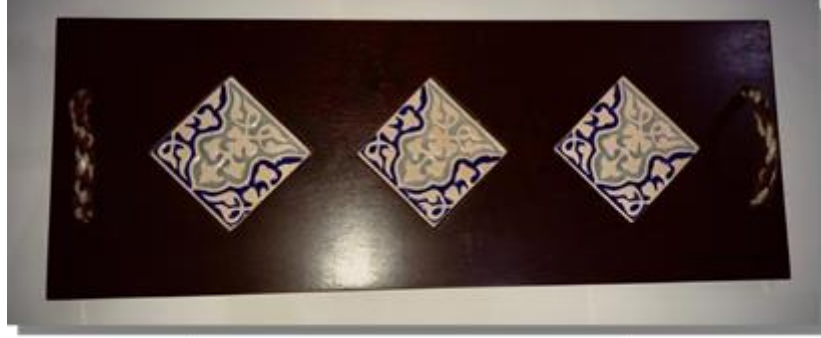
صورة رقم ( 8 )

تم تنفيذ التابلوه من خشب الموسكي مقاس 95*30 وباستخدام حفر الرواتر لتركيب بلاطات خزفية مقاس 12*12 بالحفر البارز والغائر باللون الابيض واللبنى الفاتح والمستمدة من الخزف الاسلامي ، كما تم تغيير الفكرة لتصميم وحدة تقديم واستخدام الخيوط الصوفية ، والتي جدلت يدويا باللون الابيض والبنى والازرق مقبضي التقديم بدلا من الاستانلس او الخشب المتعارف عليه مما يؤكد علي الهوية الثقافية والعناصر المستلهمة من تراثنا في تلك الصناعة التي ما زالت قائمة الي الان . والصورة رقم ( 8 ) توضح ذلك