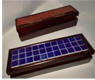
صورة رقم ( 4 )