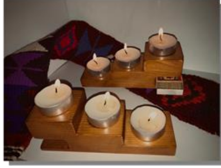
صورة رقم ( 10 )